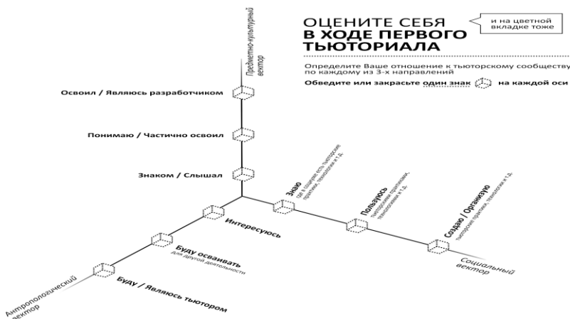
Рис. 1. Схема ресурсного расширения (Т.М. Ковалёва).